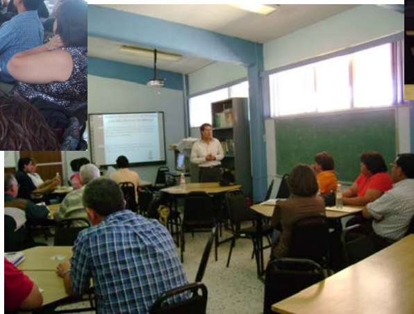
H. del Parral