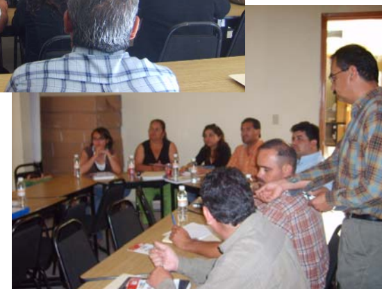
Nuevo Casas Grandes