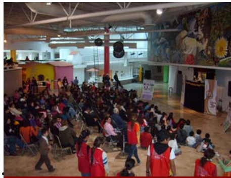
25 de Noviembre a las 16:00 hrs. Espabi