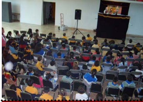
18 de Noviembre a las 12:00 hrs. Belén, Carrusel e