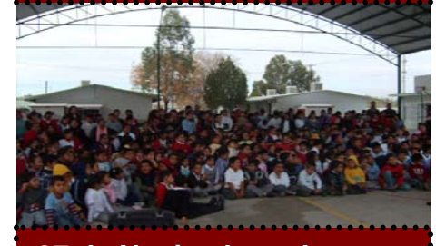
27 de Noviembre a las 11:00 hrs. Rosario Castellanos