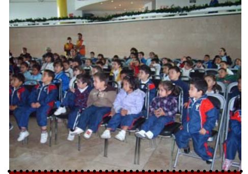
25 de Noviembre a las 12:00 hrs. Zinder Ymca