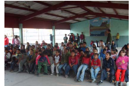
27 de Noviembre a las 14:00 hrs. Asilo de Niños y Casa Hogar I.B.P.