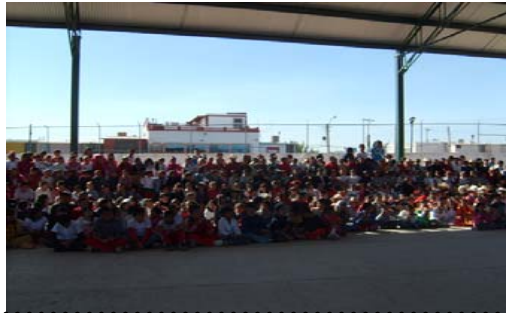
20 de Noviembre a las 10:00 hrs. Rev. Mexicana