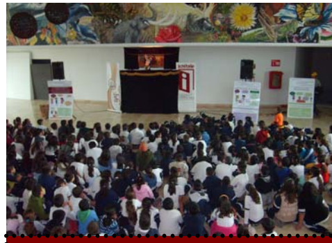
26 de Noviembre a las 12:00 hrs. Gabriel Mistral