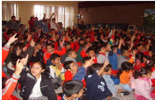
28 de Noviembre a las 9:00 hrs. Libertadores