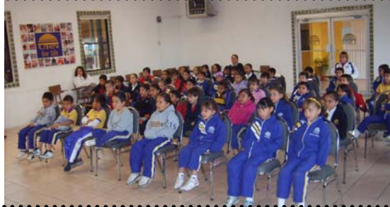
26 de Noviembre a las 8:30 hrs. Jardín de Niños de la URN