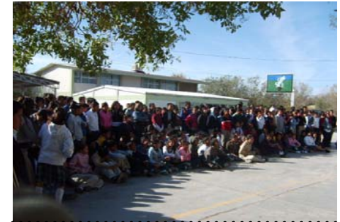
24 de Noviembre a las 9:00 hrs. Sec. Tec. No. 82