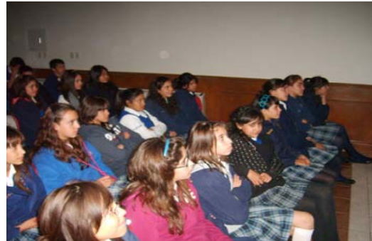
24 de Noviembre a las 12:00 hrs. Secundaria La Salle