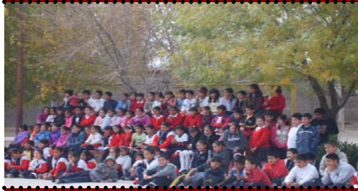
25 de Noviembre a las 11:00 hrs. Ford 160 (TM)