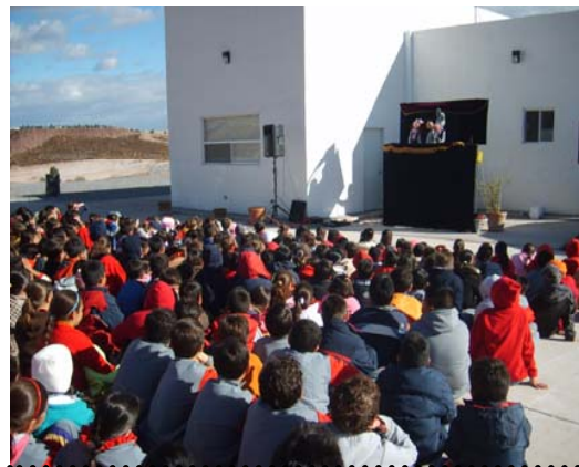
27 de Noviembre a las 8:30 hrs. Instituto Hamilton