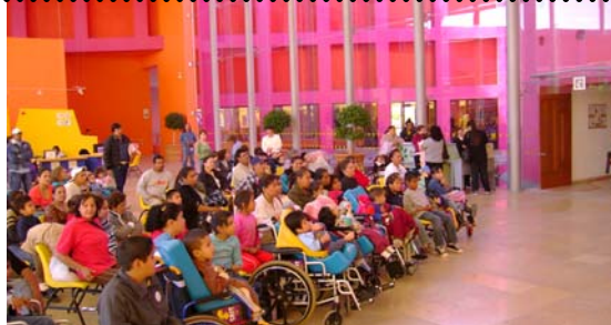
28 de Noviembre a las 12:00 hrs. CRIT