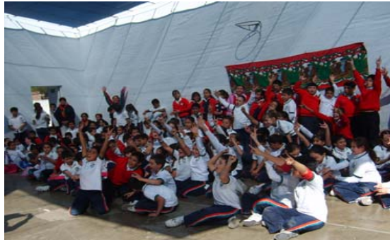
20 de Noviembre a las 12:00 hrs. Esc. Primaria Mi Mundo