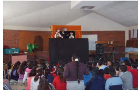
21 de Noviembre a las 14:00 hrs. Ford 160 (TV)