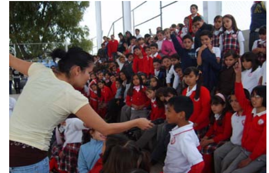
25 de Noviembre a las 9:00 hrs. Prim. Provector Montana