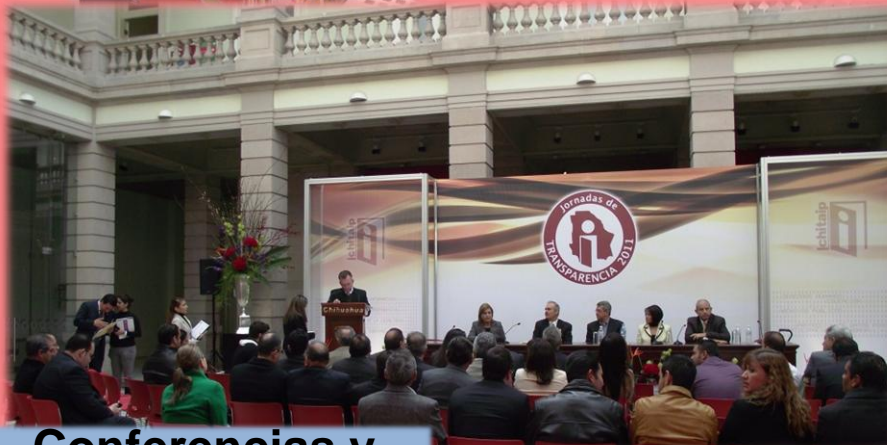
Conferencias y mesas pánel