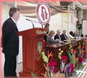
Firmas de Convenios

Por instrucciones del Consejo General del Instituto, y en coordinación con las diversas áreas operativas de la Institución, se participó activamente en las tareas de planeación, organización y desarrollo de las Jornadas de Transparencia 2011, mismas que tuvieron lugar los días 17 y 18 de noviembre del año en curso, en el Museo Casa Chihuahua y en el Semilla Museo-Centro de Ciencia y Tecnología.