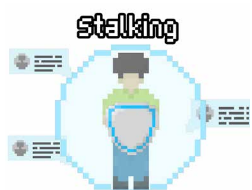
3er Lugar Concurso de Video