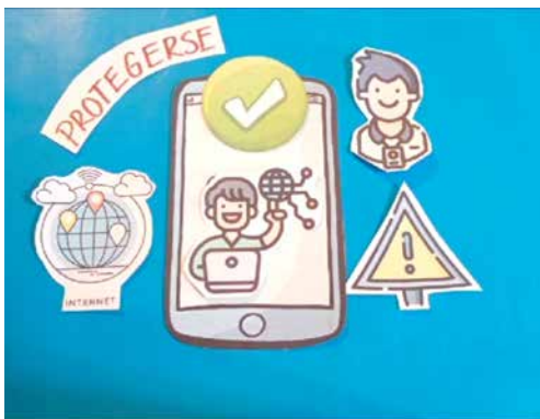
1er Lugar Concurso de Video